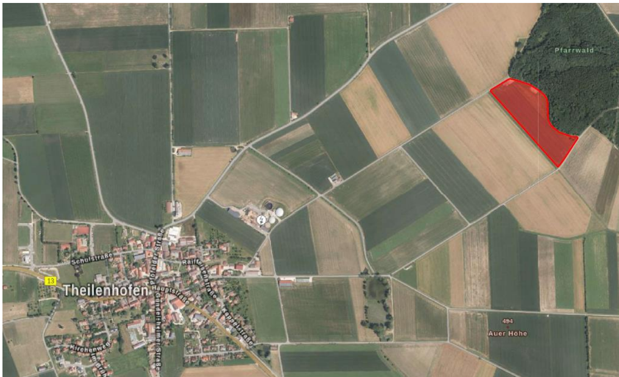
Rot dargestellt: geplanter Änderungsbereich des Flächennutzungsplans der Gemeinde Theilenhofen